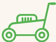
TONDEUSE DÉCHIQUEUSE ET LAME