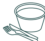
Vaisselle et contenants (compostables, biodégradables et polystyrènes)